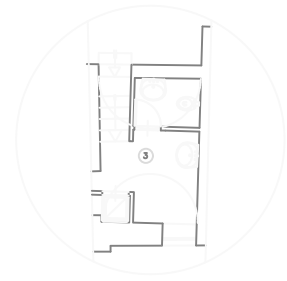
PIANTA AMMEZZATO scala 1:100