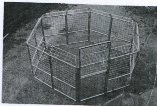
TRAPPOLA ESAGONALE PER CINGHIALI FVG L.23.113

Selettiva ed ecologica, sicura per gli operatori e umana per gli animali catturati. Progettata e costruita utilizzando esperienze decennali di operatori, ricercatori e tecnici forestali. Smontabile in 12 pannelli di dimensioni cm 100x190h, leggeri e facili da trasportare. In un pick-up standard si può trasportare una trappola completa e due persone la rimontano in poco tempo.